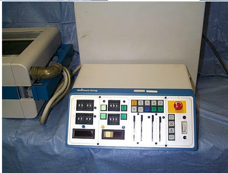
Microtomo, Reichert -Jung, Modelo Polycut E